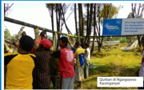
Qurban di Ngargoyoso Karanganyar