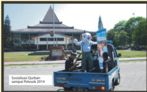
Sosialisasi Qurban sampai Pelosok 2014