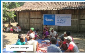
Qurban di Grobogan