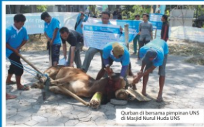
Qurban di bersama pimpinan UNS di Masjid Nurul Huda UNS