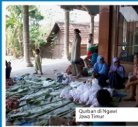
Qurban di Ngawi Jawa Timur